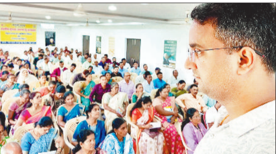
उन्मुखीकरण में भाग लेते प्राथमिक शालाओं के प्रधान पाठक।