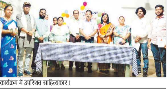
कार्यक्रम में उपस्थित साहित्यकार।

जशापुरनगर। साहित्य जगत के यथार्थवादी पुरोधा मुंशी प्रेमचंद की जयंती पर नगर में एक ऐसा आयोजन हुआ, जिसने साहित्य की केवल शब्दों तक नहीं रुकना और वेतना तक पहुंचा दिया। प्रगतिशील लेखक संघ कुनकुरी इकाई द्वारा जिला शिक्षा एवं प्रशिक्षण संस्थान के प्रांगण में आयोजित यह कार्यक्रम प्रेमचंद की कालजयी कहानी 'कफन' के सजीव वाचन, शोध संवाद और विचार प्रतियोगिता के साथ सम्पन्न हुआ। इस आयोजन में जिले के 7 प्रमुख शैक्षणिक संस्थानों के विद्यार्थियों और शिक्षकों की 150 से अधिक सहभागिता रही। कार्यक्रम की सबसे सशक्त प्रस्तुति रही — 'कफन' का सजीव वाचन। शोष पेज 4 पर