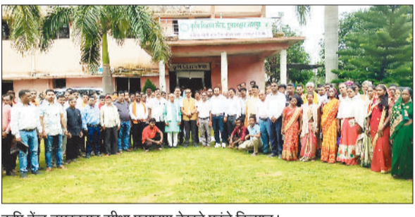
कृषि केंद्र डूमरबहार सीधा प्रसारण देखने पहुंचे किसान।

प्रधानमंत्री नरेंद्र मोदी ने शनिवार को पीएम किसान सम्मान निधि योजना के 20 वीं किस्त के तहत देशभर के किसानों के बैंक खातों में 20,500 करोड़ रुपये से अधिक की राशि का डिजिटल माध्यम से स्थानांतरण किया। इस अवसर पर जशापुर जिले के 73,555 किसानों के खाते में कुल 15.91 करोड़ रुपये हस्तांतरित