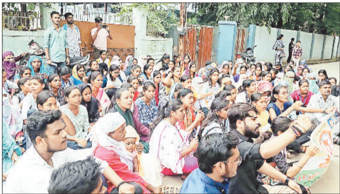
विरोध प्रदर्शन करते छात्र।

संत गहिरा गुरु विश्वविद्यालय द्वारा सत्र 2024-25 के परीक्षा परिणाम घोषित किए जाने के बाद विश्वविद्यालय के वि वि - न संकायों से बड़ी संख्या में छात्र अपने परिणामों को लेकर असंतुष्ट नजर आए, जहां उनके अंकों में व्यापक त्रुटियां पाई गईं। छात्रों ने इस संबंध में कई बार आवेदन देकर विश्वविद्यालय प्रशासन से संपर्क किया किंतु कोई ठोस समाधान नहीं निकला जिससे छात्र न सिर्फ निराश है बल्कि परिणाम को लेकर आक्रोशित है। आज छात्रों ने आजाद सेवा संघ के विश्वविद्यालय परिसर में धरना प्रदर्शन कर घेराव किया तथा तीन सूत्रीय मांगों को लेकर कुलपति को ज्ञापन सौंपा।