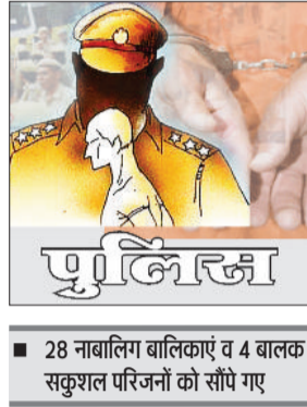
28 नाबालिग बालिकाएं व 4 बालक सकुशल परिजनों को सौंपे गए