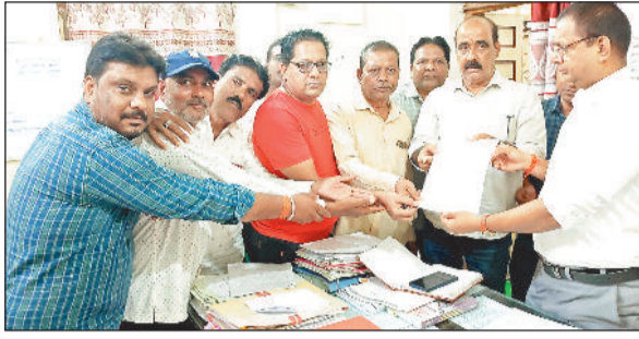
हस्ताक्षर से तैयार ज्ञापन सौंपा