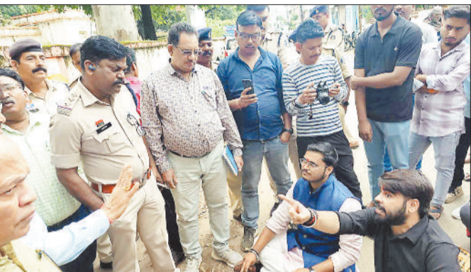
छात्रों को आश्वासन देते कुलपति।

संत गहिरा गुरु विश्वविद्यालय द्वारा सत्र 2024-25 के परीक्षा परिणाम घोषित किए जाने के बाद विश्वविद्यालय के वि वि - न संकायों से बड़ी संख्या में छात्र अपने परिणामों को लेकर असंतुष्ट नजर आए, जहां उनके अंकों में व्यापक त्रुटियां पाई गईं। छात्रों ने इस संबंध में कई बार आवेदन देकर विश्वविद्यालय प्रशासन से संपर्क किया किंतु कोई ठोस समाधान नहीं निकला जिससे छात्र न सिर्फ निराश है बल्कि परिणाम को लेकर आक्रोशित है। आज छात्रों ने आजाद सेवा संघ के विश्वविद्यालय परिसर में धरना प्रदर्शन कर घेराव किया तथा तीन सूत्रीय मांगों को लेकर कुलपति को ज्ञापन सौंपा।